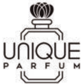
► U Million 100mL